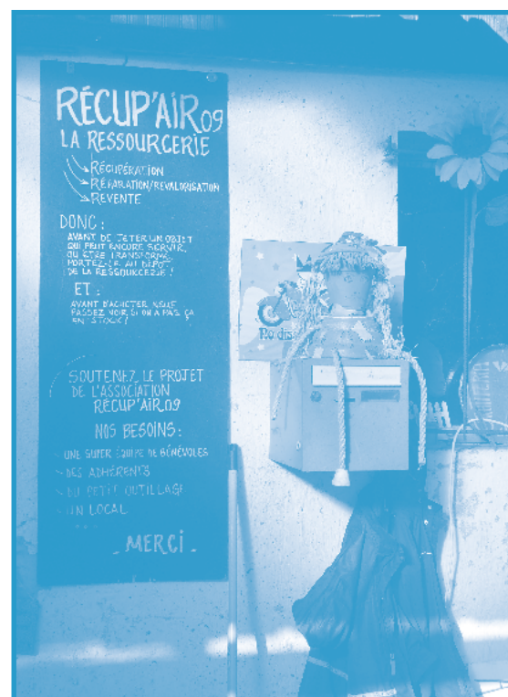
Visite dans le Couserans : ressourcerie de Saint-Girons.