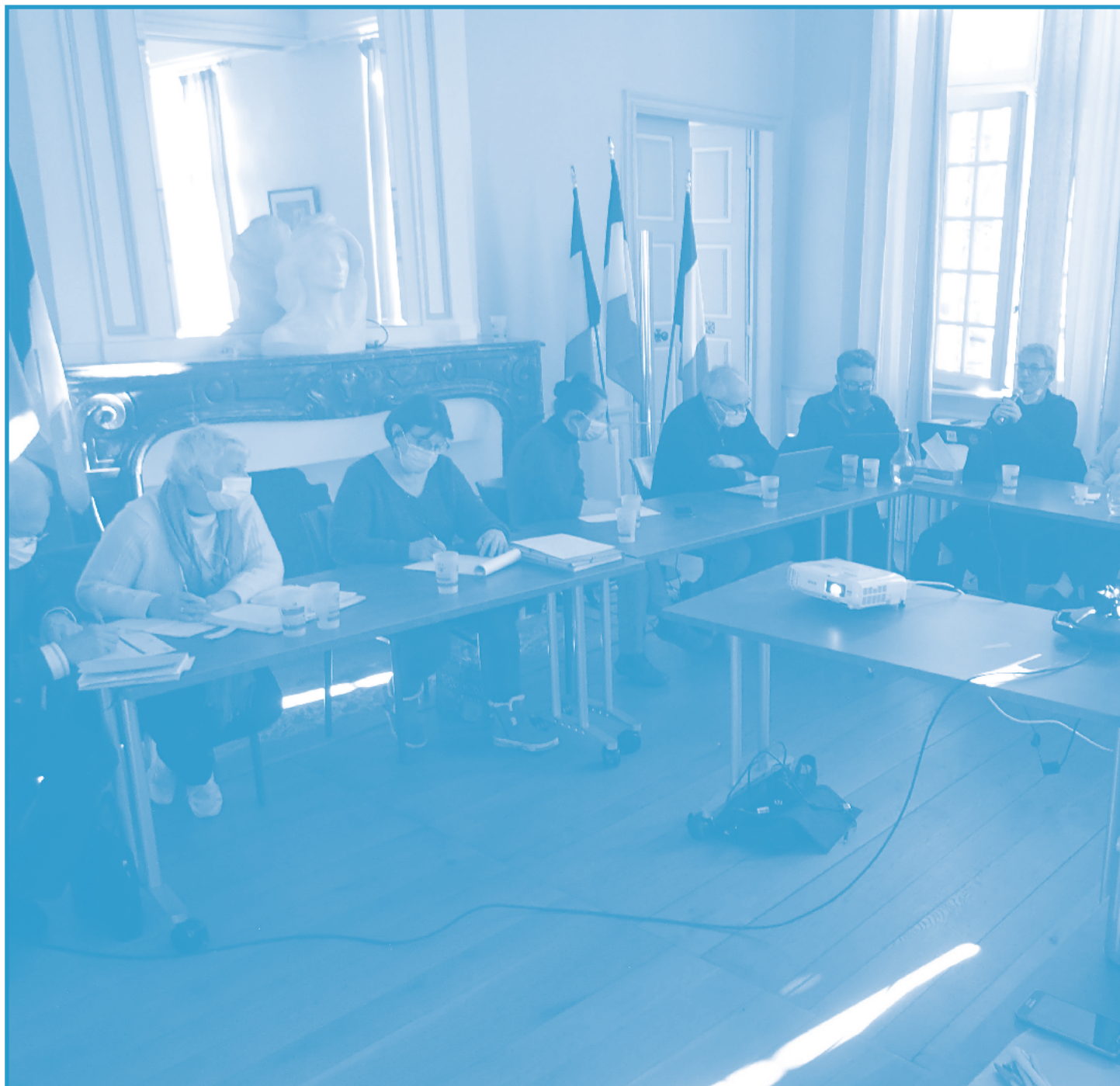
Visite dans le Couserans : rencontre avec les élu-es de la com com et du département.